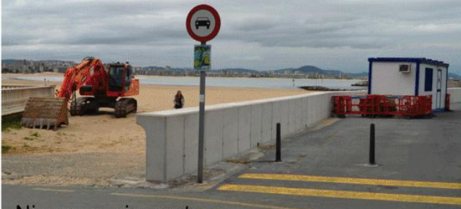
Ni muros, ni muretes...