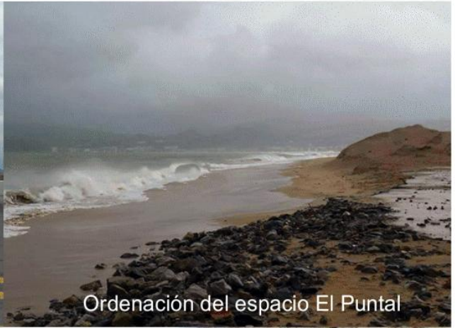
Ordenación del espacio El Puntal