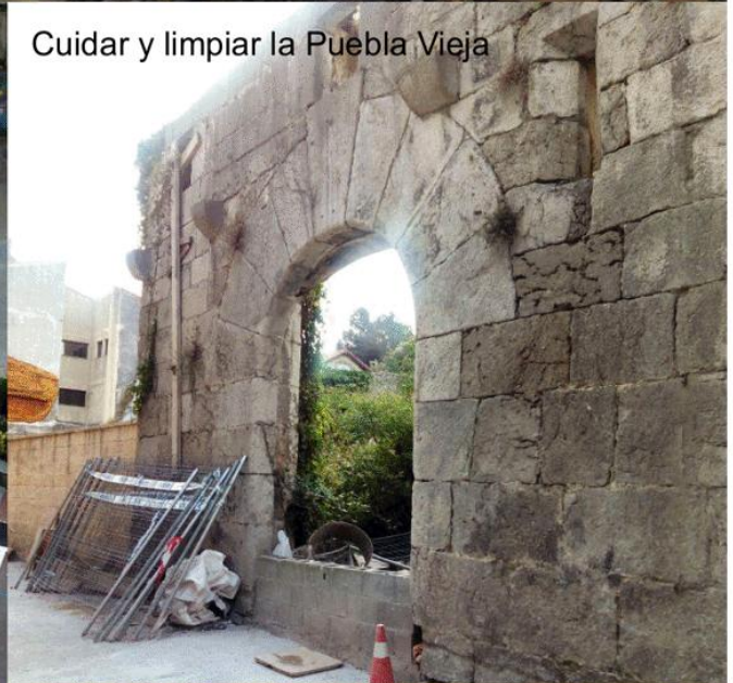
Cuidar y limpiar la Puebla Vieja